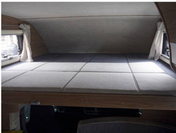
広々としたバンクベッド