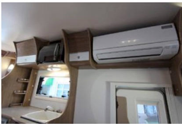
家庭用エアコン 霧ヶ峰