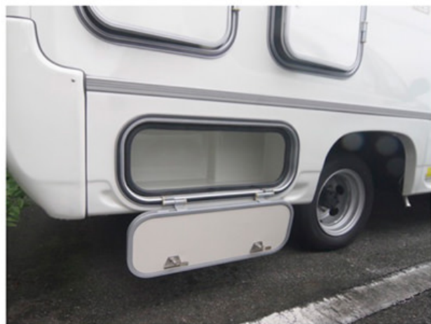
生ゴミ収納スペース