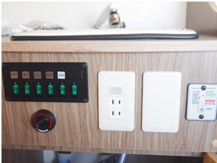
FFヒータ・インバーター・外部電源