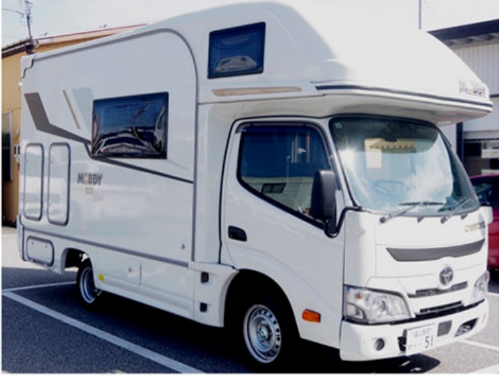
ボディサイズは499cm × 192cm × 280cm