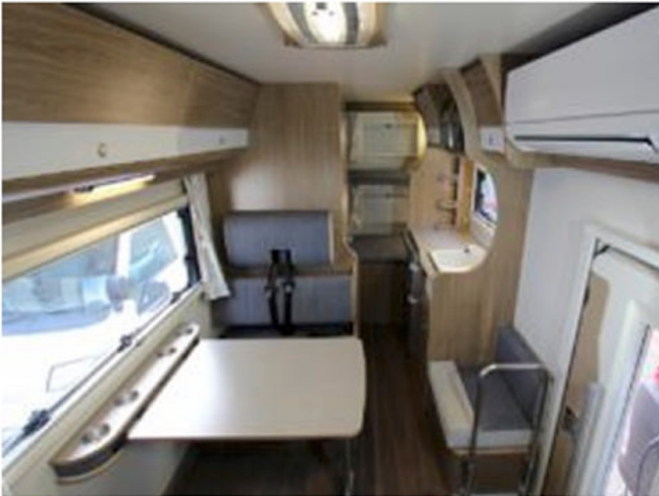
開放感のある室内と大きな窓