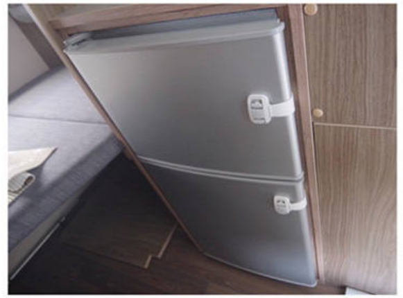
開閉防止ベルト付き