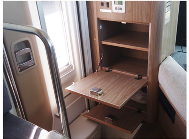
入り口には下駄箱（土足厳禁）