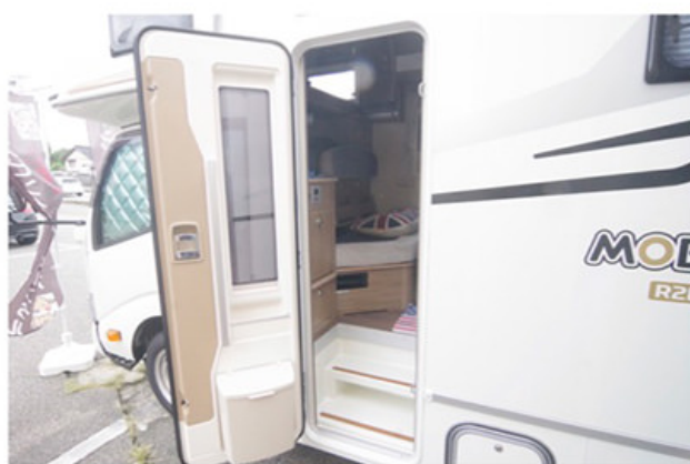
出入りしやすい入口